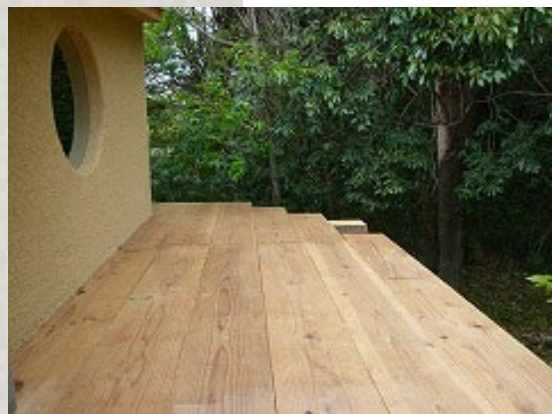
中2階に設けられた月日庵。周りはまるでツリーハウスのように空中の デッキが庵を取り囲む。まさに森の中の茶室。ここで月日を思いめぐら すのだそう。