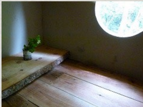
気持ちの良い杉の足場板のままの床。床の間は樺の木、皮付きのまま。 丸窓は、あえて平滑ガラスで、まるでガラスがないかのように。光を計算 した窓からは床の間の花活けに微妙な光が遊ぶ。

月日庵は森に向かって立つ鉄骨造の 建物の中2階にしつらえられたまるでツ リーハウスのような茶室。芭蕉の「奥の 細道」から月日は百代の過客にして… というところから来たもの。大きな地松の 木で足場を作り、階段は一抱えほどの 杉材の丸太を削って作りました。手すりは 蔓。そして庵内にはスサ入りの土壁。 モミの木をそのまま使った小さな床の間 と違い棚。なんと総工費は100万円くら い。まあ材料の多くを久万高原の造林 家から分けてもらったのだそう。